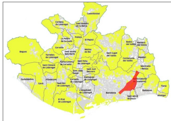
la ciutat metropolitana de 36 municipis

La ciutat de la dictadura estava orientada des del sud-oest cap al centre, igual que els nivells de renda, amb l'abandó durant molt temps del nord i l'est de la ciutat. Més tard, els projectes de monumentalització urbana a IX Barris, la Vila Olímpica, juntament amb la prolongació de la Diagonal fins al mar, han intentat pal·liar, en part, aquesta descompensació.