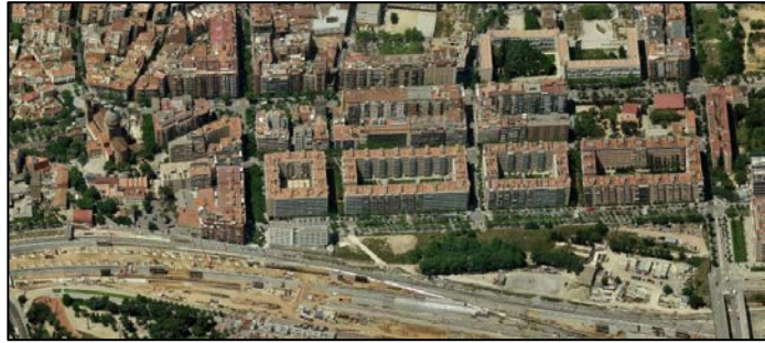
terrenys antiga FNCCE