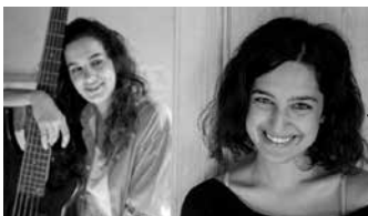
fotografia: Ágala&Laura Freijo

El grup Ágala conjuntament amb la dramaturga Laura Freijo, ens presentaran un concert íntim i carregat d'emocions.